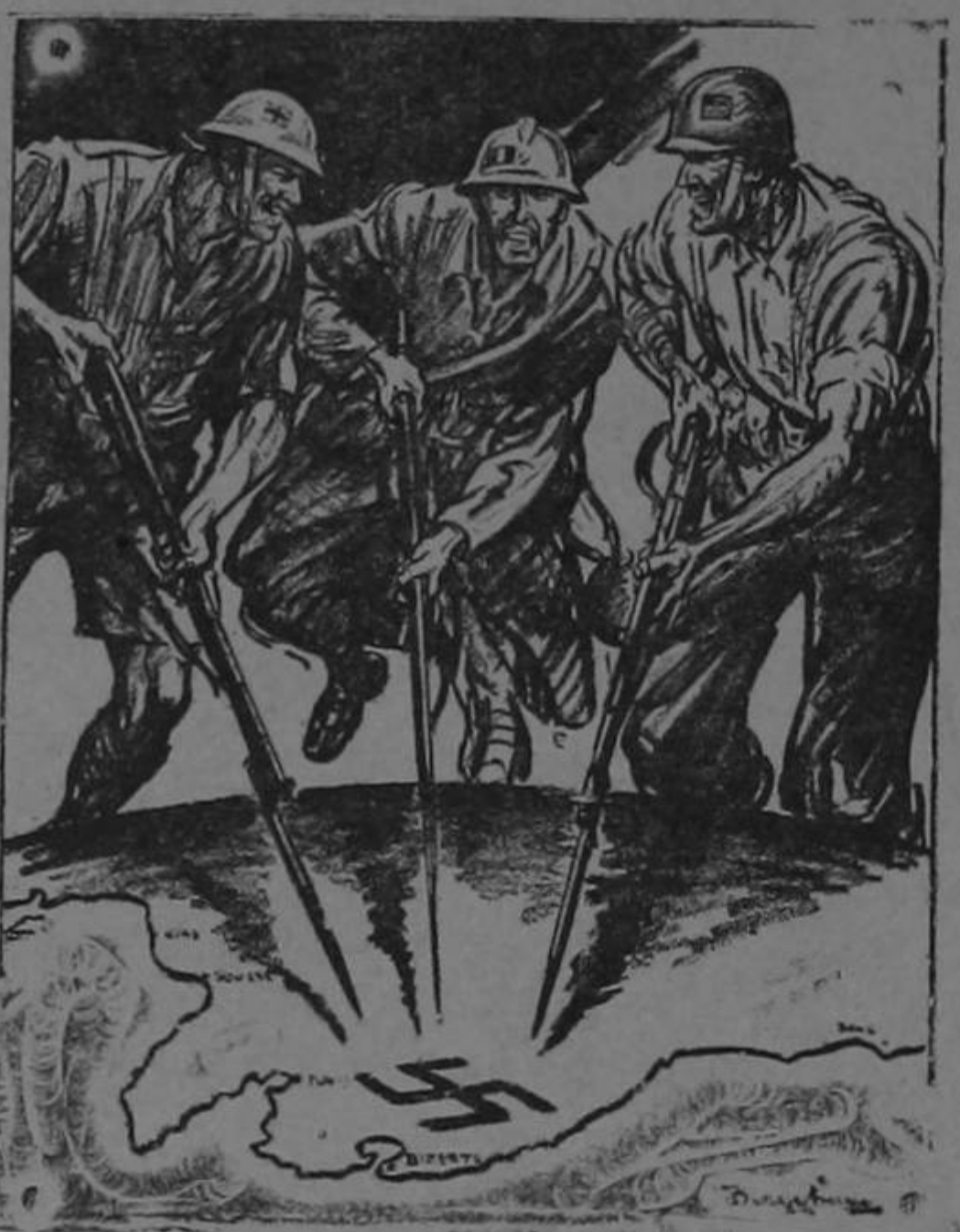
LOS TRES MOSQUETEROS

Terminada la reunión los presentes se fueron a la Eureka a tomarse un café. Cuando ellos entraban, por una curiosidad de la vida, uno de los empleados de la Eureka les decía a sus compañeros: —¡Ojo, mucho ojo y cuenten las cucharas...!