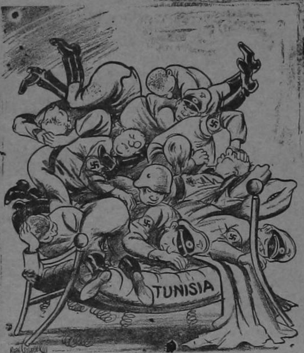
EL ALOJAMIENTO DE TUNISIA SE HACE CADA VEZ MAS DIFICIL

Para esos distinguidos caballeros, nuestro reconocimiento muy sincero.