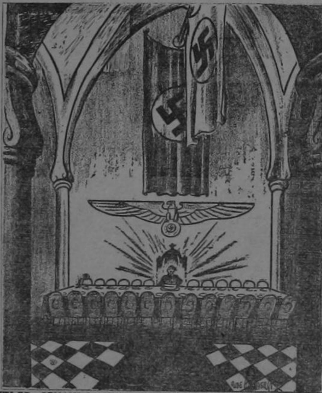
HITLER CENANDO CON SUS AMIGOS Y ALIADOS

Por el placer de tomarla y por el orgullo de tomar lo mejor, pide usted la deliciosa