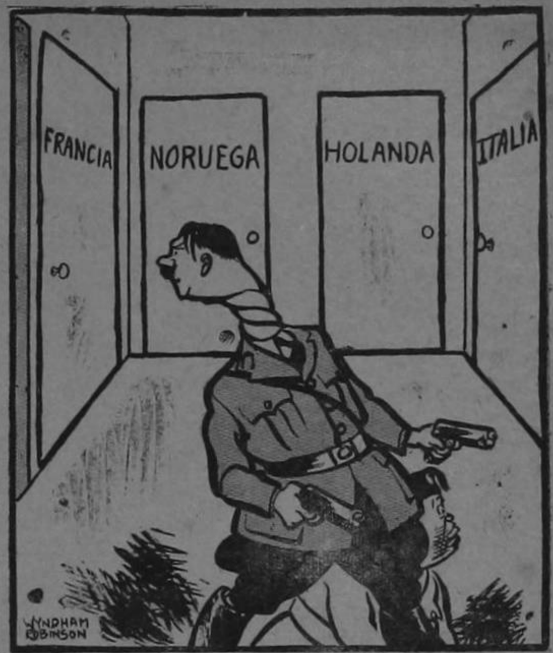
UNA CRISIS DE NERVIOS