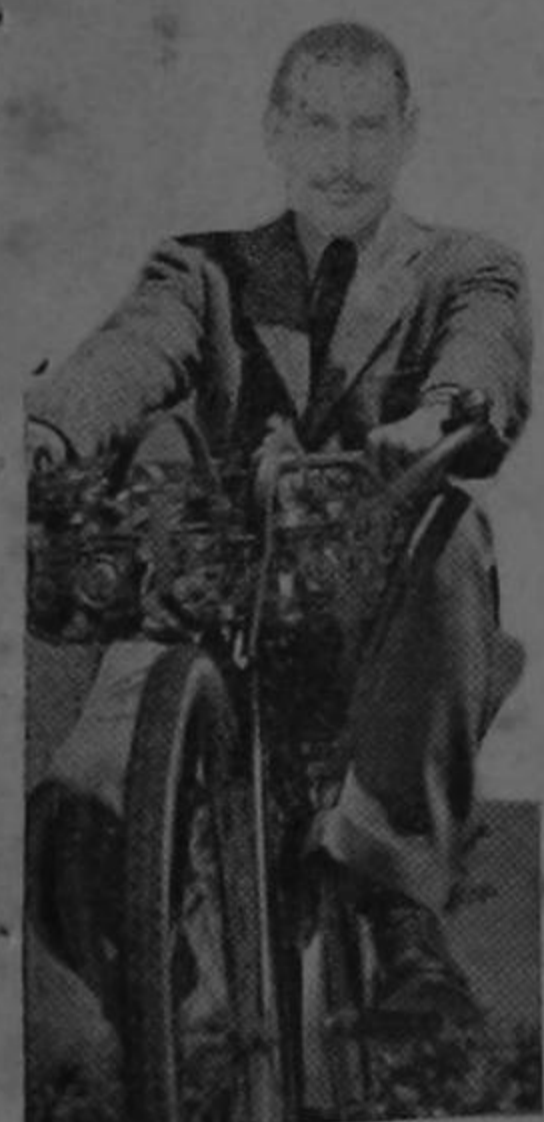
CON BUEN VIENTO, BUENAS LLANTAS, BUENOS FRENSOS Y CUESTA ABAJO.

El jueves a las cuatro de la tarde fué trasladado a la Clínica del doctor don Antonio Facio, un enfermo muy grave: el Partido Cortesista. Llegó allí casi estirando la pata y sus deudos se encontraban muy afligidos. Don León, muy pálido y muy ojeroso, le preguntaba al distinguido galeno: