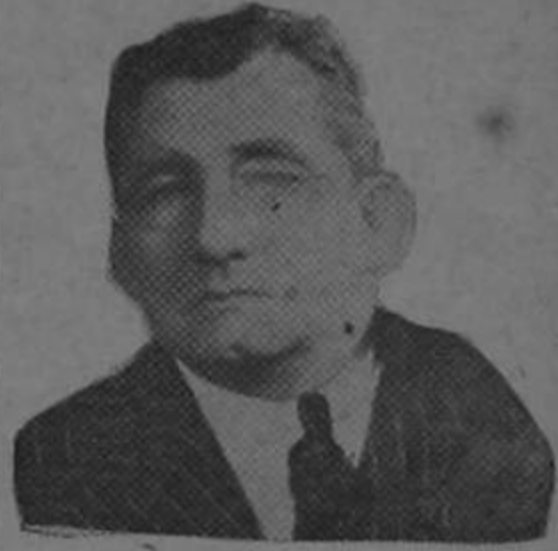
—SI, SI, YO SOY DEMOCRATA

se busque a un sacerdote para que le suministre los santos óleos. Hay